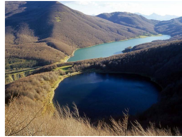
Passo di Lagastrello