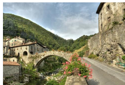
Foce di Radici