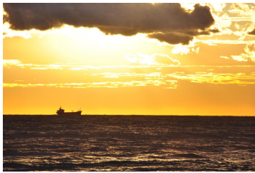
Sonnenuntergang in Marina di Massa Mario Rudolf 2010