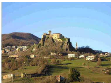
Burg von Bardi