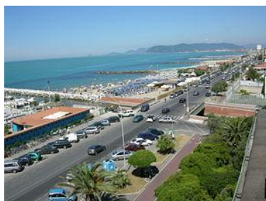
Marina di Massa